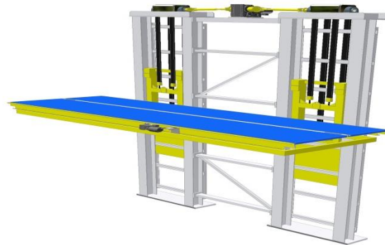
Schema des Gurthebers Pattern of vertical lift